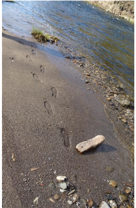
Foto: Fußspuren an der Mulde in Wechselburg